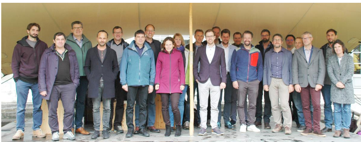
Gründungsgruppe der STE-AoC am 29. September 2022 in Bern.

Download Druckdatei (2831 x 1109 px, 2.05 MB)