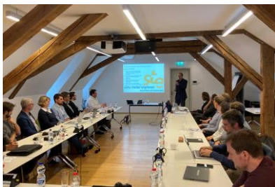
Gründungsversammlung der Swiss Timber Engineers Association of Construction (STE-AoC) am 29. September 2022 in Bern.

Download Druckdatei (3568 x 3408 px, 2.79 MB)